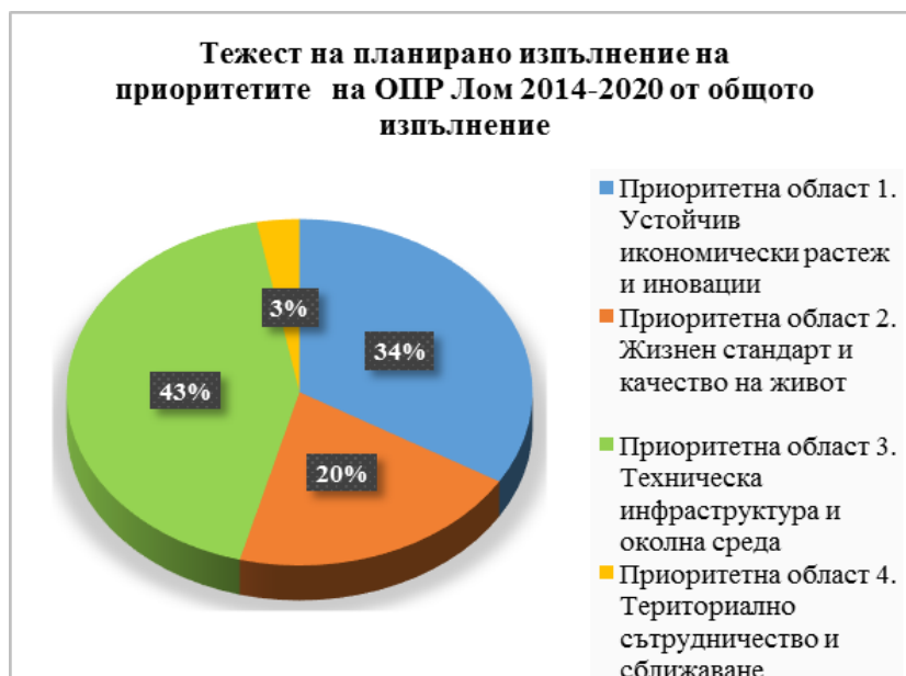
Фигура 1. Финансово изпълнение на приоритети от ОПР 2014-2020 г. до 2016 г.

Графичният материал ни показва, че сравнително не са спазени зададените тежести по приоритети. На първо място по изпълнение е Приоритетна област 2, която заема най-голям дял в изпълнения, но не и в планирания бюджет. На второ място е договореният и изпълнен бюджет по Приоритетна област 3 с оглед на изпълнените инфраструктурни проекти. На трето място е договореният бюджет по Приоритетна област 1 за развитие на икономиката, но доста под очакванията. А договореният и изпълнен бюджет по Приоритетна област 4, който е най-малък като сума, надхвърля три пъти заложените очаквания за него.